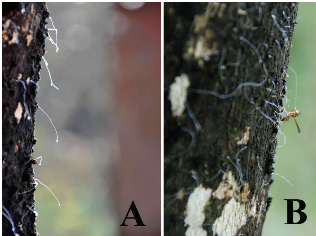
Figura 1. Stigmacoccus paranaensis en tronco de M. scabrella . A. Pelos blancos largos que parten de los quistes. B. Himenóptero alimentándose de mielato, exudado del insecto escama.