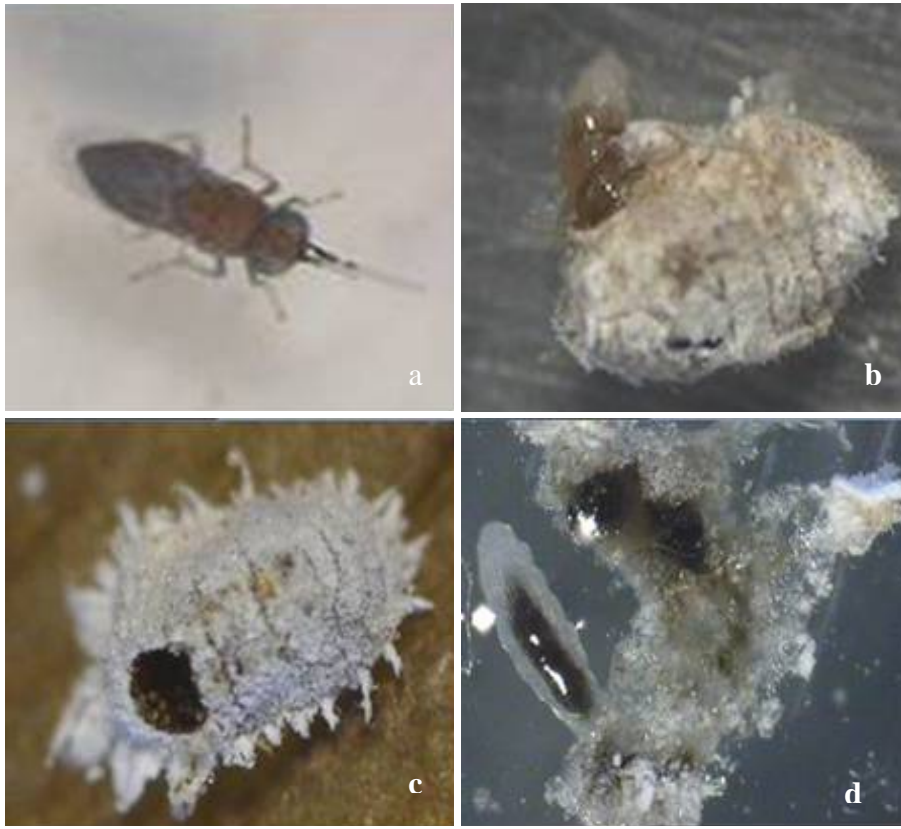
Şekil 1. Ergin Anagyrus pseudococci dişi (a), parazitoit çıkışı (b) mumyalaşmış unlubit ve parazitoit çıkış deliği (c), parazitoitin kapsüllenmiş yumurtaları ve sağlıklı larvası (d).

*Aynı sütundaki farklı harfler arasındaki fark istatistiki olarak önemlidir (P<0.01).